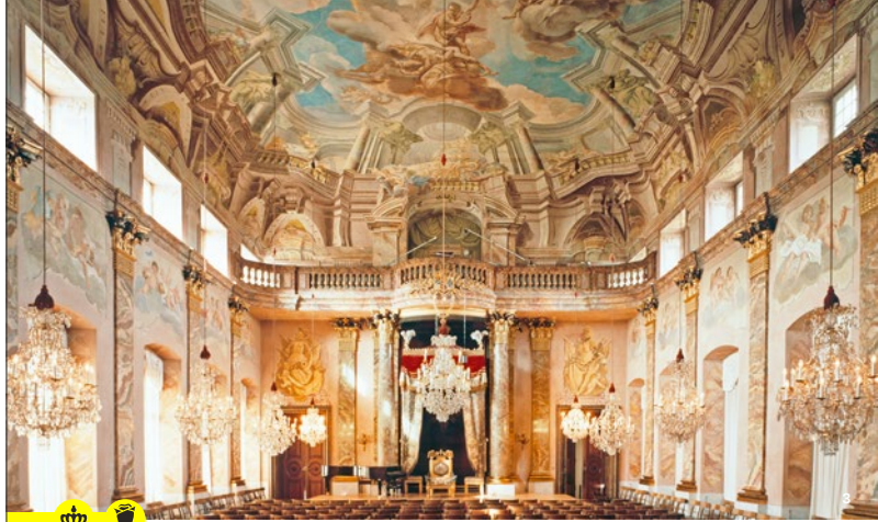
El Salón de la Orden resulta impresionante con sus frescos barrocos del techo y el trono del rey Federico I de Württemberg